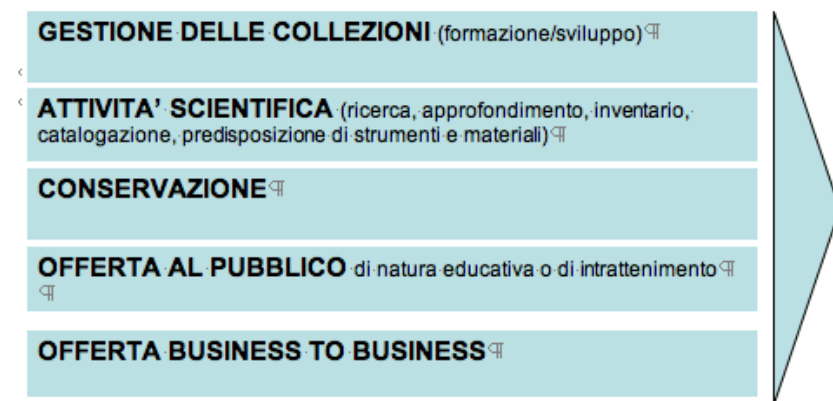
Figura 2. Le attività primarie dei musei

La commissione ha individuato cinque attività logicamente collegate, ma non gerarchizzate (Figura 2) che convivono necessariamente, anche se le loro dimensioni e peso reciproco possono evidentemente variare a seconda delle istituzioni considerate.