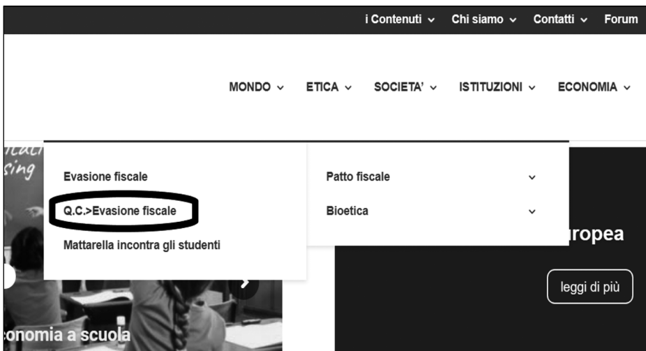
FIG. 2. Spazio specifico Q.C.

Nonostante si cercasse, fin dalle prime prove, di tenere congiunta al rigore documentale e argomentativo la chiarezza nell'esposizione, eravamo consapevoli che questo non basta per raggiungere direttamente un pubblico adolescente. Nella sua prima fase realizzativa, tuttavia, Civitas ha sviluppato solo un versante,